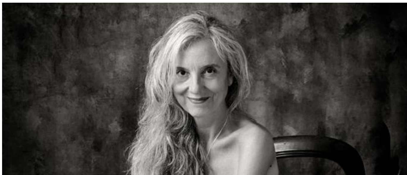
Pere Colom retrata a las diosas de hoy. Imágenes del libro, que según su autor demuestra el empoderamiento femenino. / PERE COLOM

El fotógrafo presenta mañana en el Colegio de Abogados un libro de desnudos femeninos inspirados en las modelos de las obras clásicas